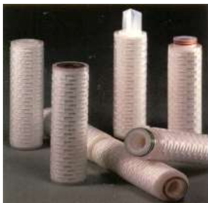
ELEMENTOS PLISSADOS ABSOLUTOS